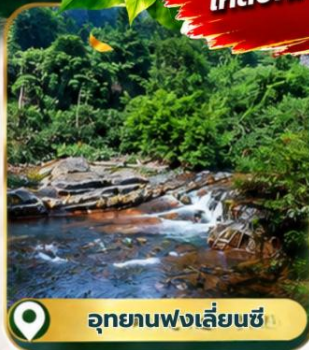
อุทยานฟ่งเลี่ยนซี