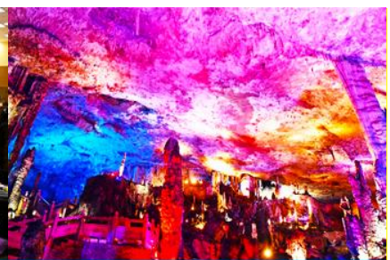
ถ้าเก้าสวรรค์วิวเทียนถั่ง