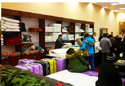
ศูนย์จำหน่ายผลิตภัณฑ์ยางพารา