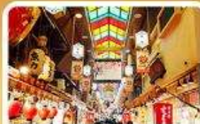
ตลาดปลาชิคิ