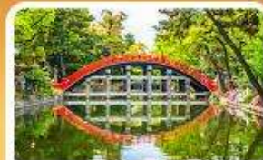
ศาลเจ้าสุมิโยชิ โทคะ