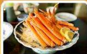
พิเศษ! ชาปู