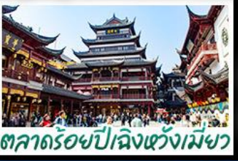
ตลาดร้อยปีเฉิงหวงเมี่ยว