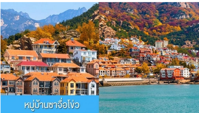
หมู่บ้านซาจิวโข่ว