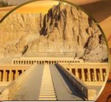
หุบเขากษัตริย์