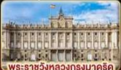
พระราชวังหลวงกรุงมาดริด