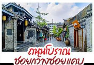
ถนนโบราณ ชอยกวางชอยเคบ