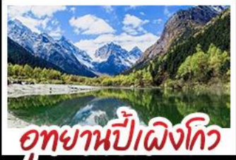
อุทยานปี่ผิงโกว