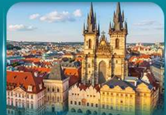
ชมปราสาทปราค ย่านเมืองเก่า