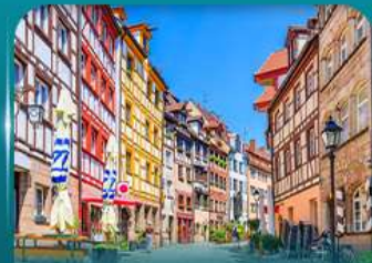
เที่ยวเมืองเก่าบูเรมเบิร์ก