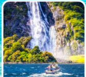
บิลฟอร์ด ซาวด์ นั่งเรือชมความงาม ฟยอร์ด