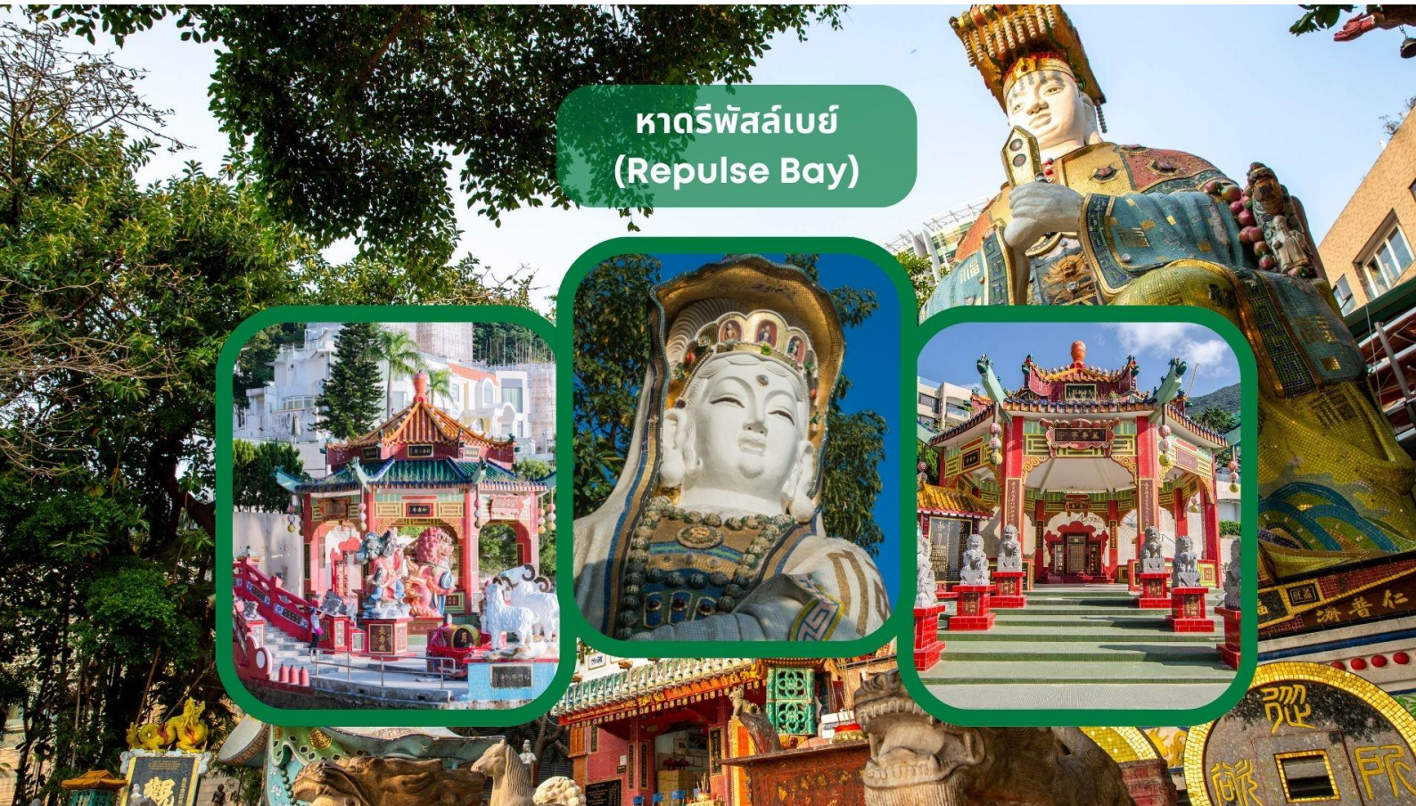
หาดรีพัลส์เบย์ (Repulse Bay)