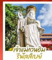
เจ้าแม่กวนอิม ร่ำฟ้าส่าย