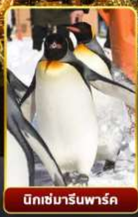
มิทซ์มารีนพาร์ค