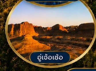
อู่เจ้อเซ่อ