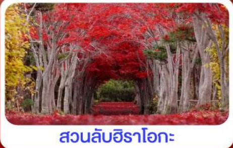
สวนลับชิราอิเกะ