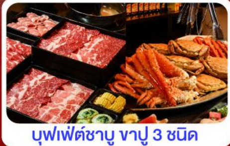
บุฟเฟ่ต์ชาบู ขาปู 3 ชนิด