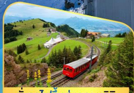
นั่งรถไฟขึ้นสู่ยอดเขาโรติก