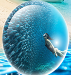
MOALBOAL ISLAND HOPPING (ดำน้ำดูปลา, เต่า, ว่ายน้ำกับปลาชาร์ตัน)