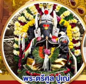
พระตรีศูล ปูणे (Trishul Pune)