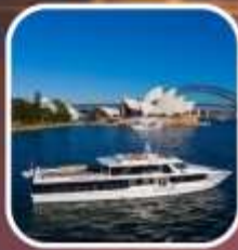
ล่องเรือชมอ่าวซิดนีย์