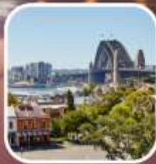
SYDNEY OBSERVATORY HILL