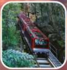
อุทยานบลูเมาท์เท็นส์